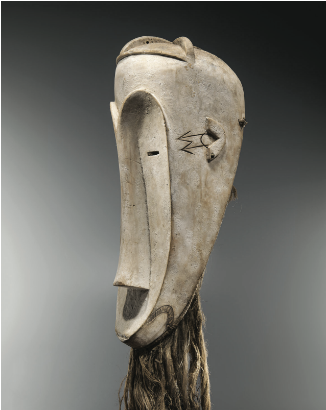
Inédit masque Fang, ngil Gabon Hauteur: 59 cm. (sans la barbe)

Masque Fang ngil inédit, bénéficiant d'un pedigree historique. Même typologie que le célèbre masque Fang de la collection Vérité vendu pour un prix record en 2006 (6 millions d'euros).