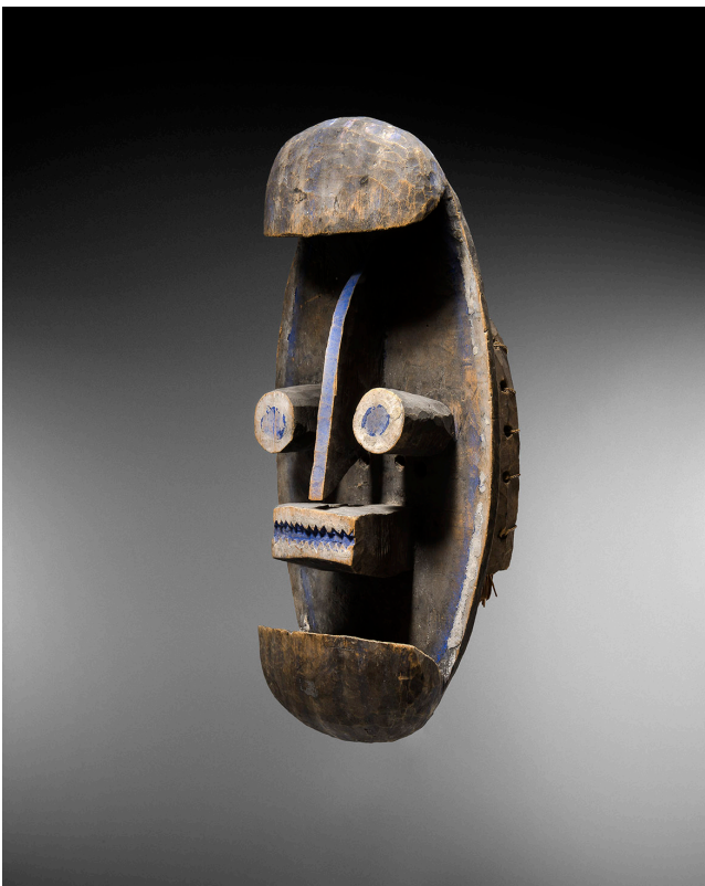
Important masque Krou/Grebo Côte d'Ivoire Hauteur: 47 cm

Picasso possédait un masque comparable. Ce type d'objet était particulièrement prisé dans les ateliers d'artiste au début du XXème siècle.