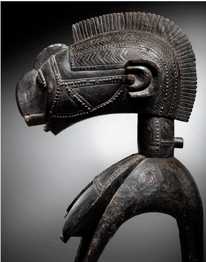
Important Masque d'épaule Baga, nimba République de Guinée Hauteur: 120 cm.