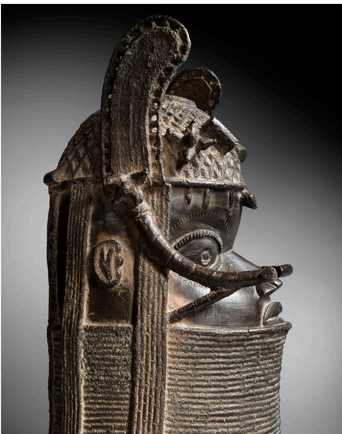
Rare tête d'Oba en bronze Nigeria, Royaume du Bénin Hauteur: 40 cm.

Il s'inspira de ce type de pièce pour une série de dessin datée de 1907, mais également pour un ensemble de portrait de Marie-Thérèse Walter qu'il réalisa dans les années 1930